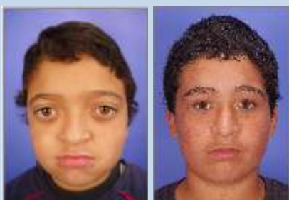
Síndrome de Crouzon